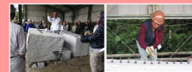
丁場に隣接する加工場にて当社でも実演している石割体験が行われました。参加者は石材業関係者なのですが、中には私を含め初めて見ると言う方が結構いた様でした。