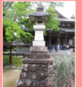
新潟県から寄進された燈籠