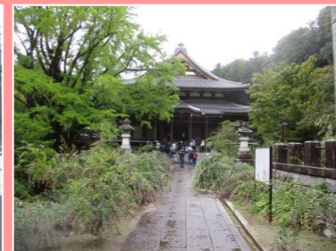
浄土真宗別格本山の西念寺境内にあった燈籠(右の写真)の台には「新潟県」「長岡玉日講中」と刻まれており、新潟県から寄進された物でした。新潟県は浄土真宗が多く、この地との繋がりが深いのだと感じました。