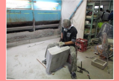
加工工場にて(むしり仕上げ) この工場での加工内容は、ほぼ当社が行っているものと同じでした。当社の加工技術の高さを実感しました。

翌日は稲田石の丁場・工場の見学でした。ジェットバーナー・火薬・ワイヤーソーという採石工法の違いなどを学んだ他、石割の体験もしました。また ビシヤン仕上げなどの石工職人による手加工の実演も見学しました。