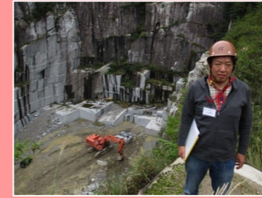
真壁小目石の丁場にて これまで丁場見学をしたことが無かったので、初めてこのような採石場を見ました。高くて怖かったです。