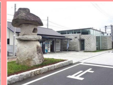
JR稲田駅(左)と「石の百年館」(右)